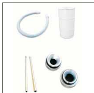
> Accessori di serie