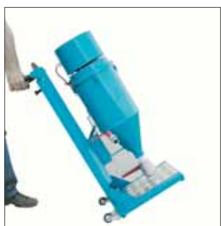
> Facilmente trasportabile