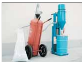
> Riempimento di Estintore Carrellato con Kit VENTURI