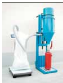
> Riempimento di Estintore Portatile