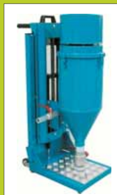
TOTEM M in posizione da trasporto

La "TOTEM-M" è stata progettata con concetti moderni tenendo in particolare considerazione le esigenze operative che si riscontrano durante la manutenzione degli estintori a polvere. Un occhio particolare è stato rivolto alle dimensioni e pesi per rendere la macchina facilmente trasportabile ed adatta soprattutto alle manutenzioni a domicilio cliente. Con l'utilizzo delle slitte di scorrimento (a richiesta) è possibile effettuare l'installazione su carri officina. Con gli accessori in dotazione e quelli a richiesta si possono ottimizzare le varie fasi di lavoro e consentire di operare con sicurezza ed efficacia. La "TOTEM-M" è costruita con materiali robusti e dalle elevate prestazioni. La semplicità di utilizzo, la ridotta manutenzione e l'ottimo rapporto qualità-prezzo permettono di soddisfare le esigenze più qualificate.